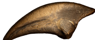
ARTIGLIO di ALLOSAURO

L'Allosauro conosciuto come lucertola bizzarra, era un carnivoro lungo circa 9-12 metri, alto 3,75 metri alla spalla e pesante 4,5 tonnellate circa, vissuto fra i 140 e i 156 milioni di anni fa. Nonostante la sua mole, doveva essere molto agile e veloce oltre ad essere uno dei carnivori più grossi di quel periodo. Per questo è chiamato "il leone del giurassico".