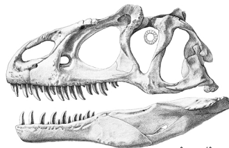
CRANIO E MANDIBOLA di ALLOSAURO