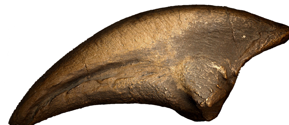
ARTIGLIO di ALLOSAURO

L'Allosauro conosciuto come lucertola bizzarra, era un carnivoro lungo circa 9-12 metri, alto 3,75 metri alla spalla e pesante 4,5 tonnellate circa, vissuto fra i 140 e i 156 milioni di anni fa. Nonostante la sua mole, doveva essere molto agile e veloce oltre ad essere uno dei carnivori più grossi di quel periodo. Per questo è chiamato "il leone del giurassico".